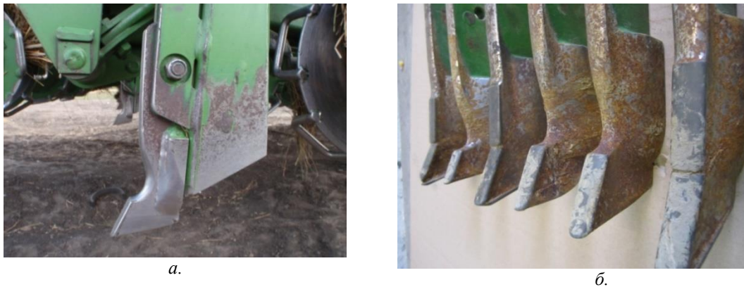
Рис. 1. Форма фигур износа долота сеялки Primera DMC-9000 при достижении предельной наработки: а - вид сбоку на изношенное долото, установленное на сеялке, б - вид спереди на изношенные долота, упрочненные производителем установкой дополнительных твердосплавных пластин

составляет 60-200 га [4]. Характер износа долота указанной сеялки показан на рисунке 1.