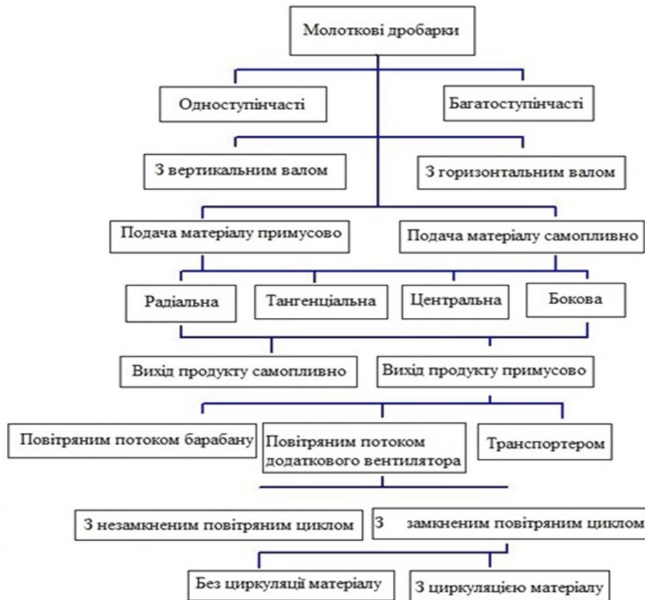
Рис.1. Класифікація молоткових кормдробарок

На сучасних підприємствах, середніх та малих фермерських комплексах та в індивідуальному використанні у господарстві, для подрібнення зерна, а також проміжних продуктів його переробки використовують такі різновиди молоткових кормдробарок (рис.2).