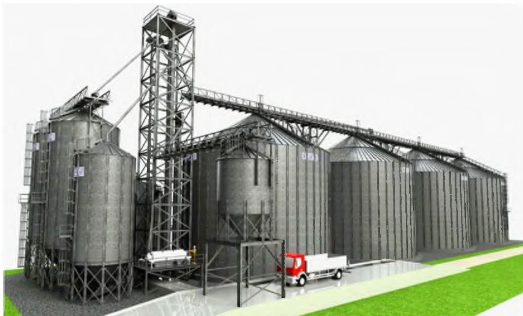
Рис. 2 – Зерновий елеватор

Зерносховища є одним з найбільш затребуваних об'єктів українського АПК (рис.2). За останні 10 років в Україні було побудовано елеваторів для зберігання більше 11 млн. т зерна (табл.2).