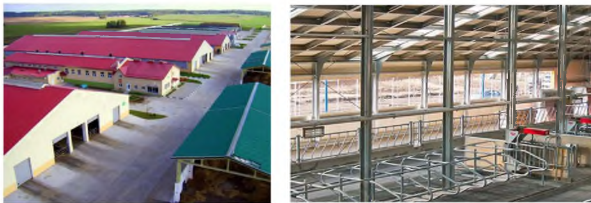
Рис. 6 – Будівля типової конструкції молочно-товарної ферми

Просування сталевих рішень серед аграріїв не лише дозволить збільшити продажі металоконструкцій в Україні, але і дасть безцінний досвід, який допоможе при освоєнні зарубіжних ринків. Керівники заводів металоконструкцій розповідають, що їх рішення все частіше використовують як українські аграрії, так і зарубіжні інвестори. Наприклад, потенційні замовники цікавляться можливістю будувати сільськогосподарські об'єкти з вітчизняних металоконструкцій навіть в далекій Африці.