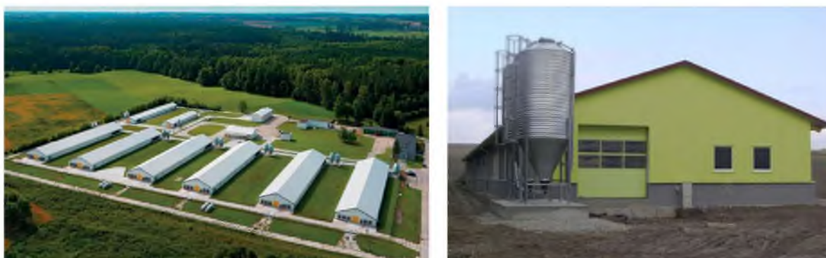
Рис. 3 – Птахофабрика

Другим по перспективності напрямом в АПК є будівництво птахофабрик (рис. 3). Незважаючи на падіння об'ємів будівництва птахокомплексів в 2015 р., з 2016 року спостерігається тенденція до збільшення попиту в цій галузі (табл.3).