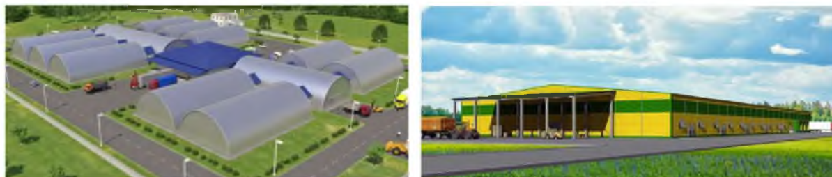
Рис. 5 – Овоче- і фруктосховища з регульованим газовим середовищем

Найближчими роками одним з найбільш перспективних напрямів аграрного будівництва стане зведення овоче- і фруктосховища (рис. 5). По-перше, існує значний дефіцит потужностей по зберіганню овочів і фруктів. Існує стабільна тенденція до вирощування плодоовочевої продукції на Україні проте за 10 років було побудовано складів для зберігання всього біля 500 тис. т. (табл. 5)