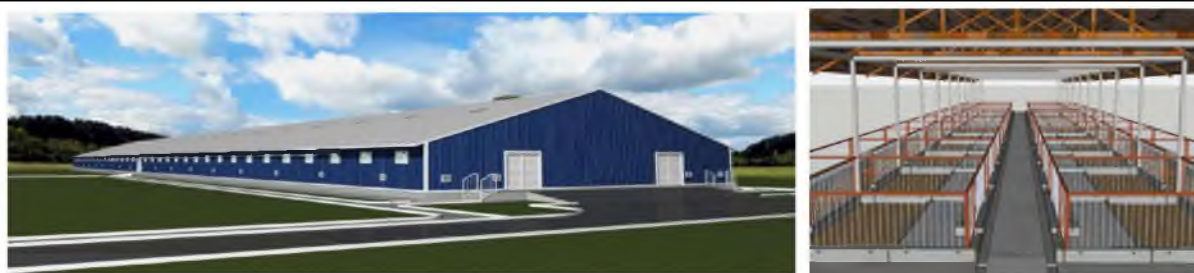
Рис. 4 – Свинарник